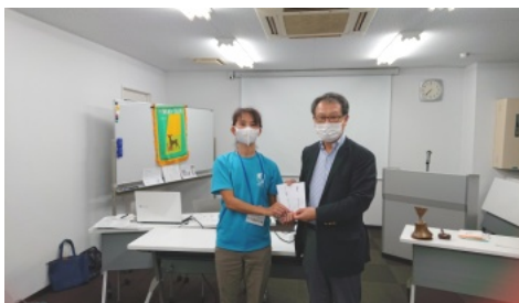
通称”しぜん基金”の中川代表理事へ四本会長から献金と謝礼