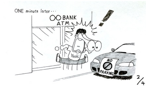
1分後「駐車禁止」のステッカーが貼られた