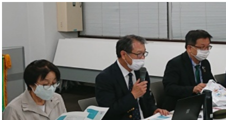
四本新会長より、資料を配布し今期の方針発表