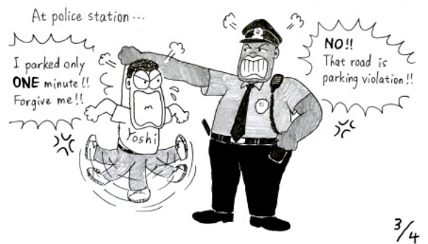
「たった1分路駐しただけや！ 許してよ!!」 「あかん!! あの道路は駐車違反や！」