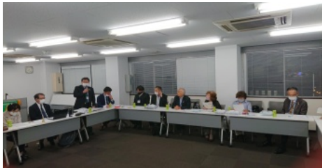
正野阪和部長と阪和部役員の方々