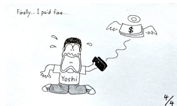
結局、罰金を払った・・・