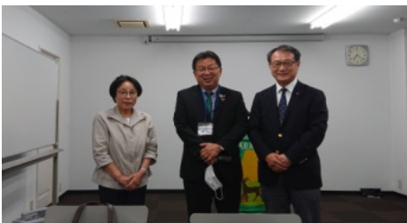
正野阪和部長立会いの下、会長交代式