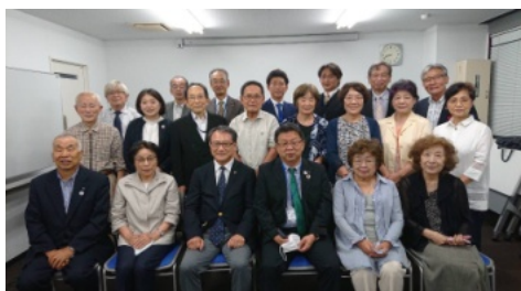
例会終了後に集合写真