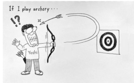
もし、私がアーチェリーをしたら...

今年から自分自身のギャグ漫画を描き始めました。出来上がった作品は、SNS(ツイッターやインスタグラム)に投稿し、世界中から注目されるようになりました。