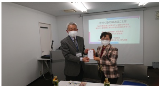
林メネット会長から濱田局長へお礼