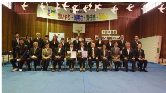
卒業リーダーの皆さん 新たな世界でご活躍を!!