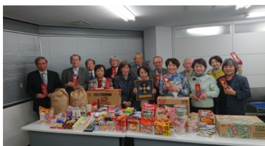
例会後、全員で贈物を前に