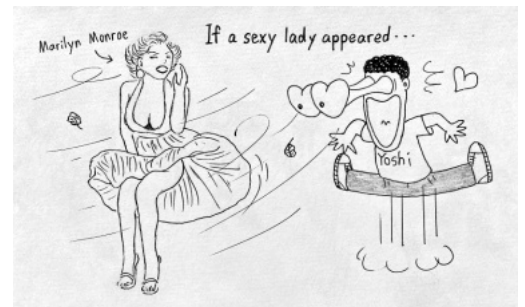
もし、セクシーな女性が現れたら...