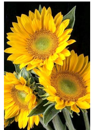
(ウクライナの国花)