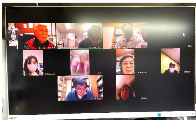
*グループLINEをパソコン画面で使用している写真です。