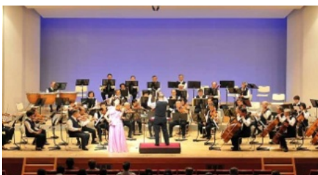
2012年、指揮する父の隣でバイオリンを弾く姉