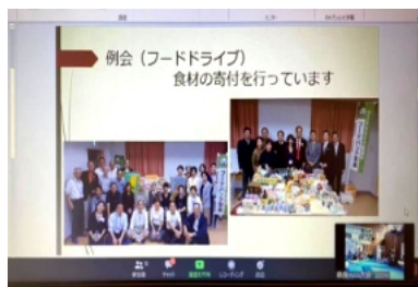
奈良クラブのスライドを披露