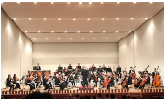
2019年、最後となった父のコンサート