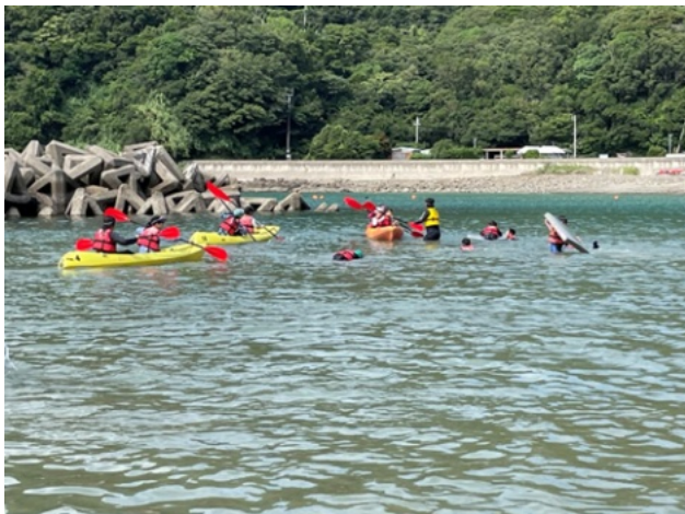
日高海の子キャンプ