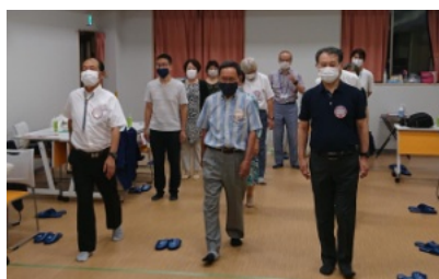
正しい歩き方、少々緊張気味ですね