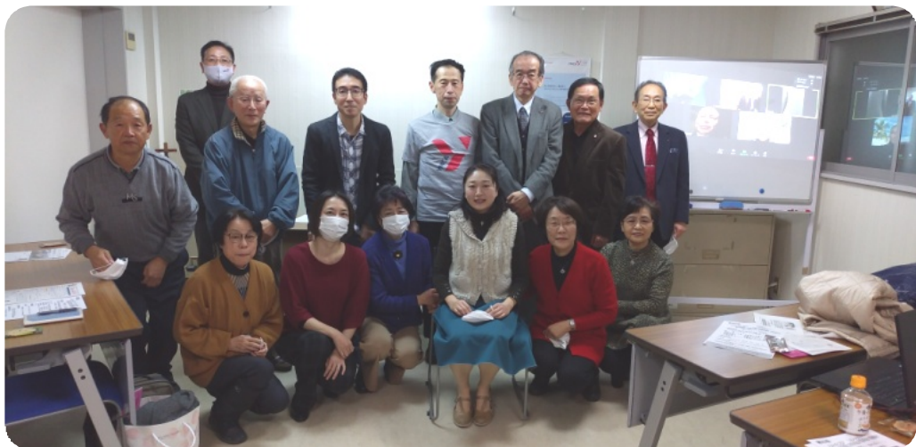
例会後の集合写真