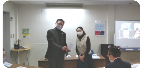
ポジティブネット献金の寄付