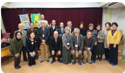
例会後の集合写真