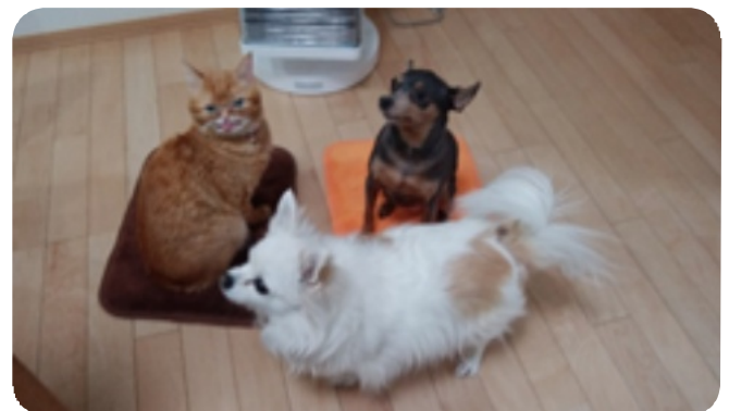
自分を猫とっていないミー太(左) 気は優しくて臆病者 美人のブリちゃん(手前) 見かけによらず情熱的にスリスリしてくるラテちゃん(右)