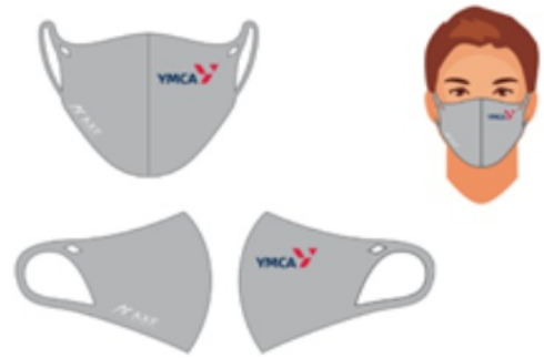
チャリティーファンドマスク