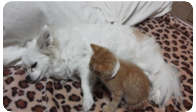
退院してきたミー太(1ヵ月) やさしく見守るブリちゃん(7才)

ブリちゃんもラテちゃんも、御主人の娘さんがペットショップに勤めていた時に、預けに来たお客さんが何ヶ月も引取りに来ずゲージに入れられており、仕方なく繁殖犬にされる所を次々に引き取ってわが家に来たと言う経緯の持ち主である。とりあえず現在は3人共、平穏な日々を過ごさせてもらっている。ただ近年は、一緒に寝ている御主人が、度々入院するので、3人で寂しく寝るのが玉に瑕である。